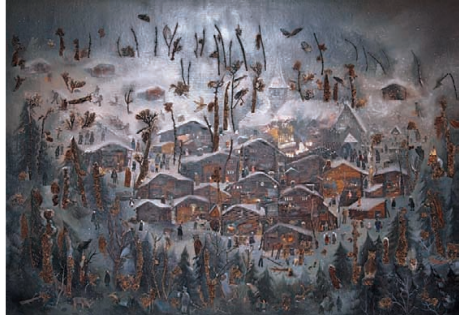
130 Personen beleben die wunderschöne Winterlandschaft von Bellwald. Das Bild stammt aus einer privaten Sammlung.

seinen Adlerhorst in Montorge. Man bezeichnet ihn als Walliser Brueghel, er erzählt in seinen Werken ganze Geschichten, seine Bilder sind pure Poesie. Er mischt mutig mit verschiedenen Materialien, fügt Federn, Moos und Birkenrinde in seine «Geschichten» ein. Diese sind mal verträumt, kindlich, fantastisch oder sarkastisch, zeitkritisch, herausfordernd. Er nimmt kein Blatt vor den Mund, wagt es, das Weltgeschehen und die Walliser Politik zu kritisieren. Die Religion spielt eine grosse Rolle in seinem Leben, er berührt und kommentiert jedoch alles mit sehr viel Humor und Witz. Sein Lachen widerspiegelt sich in seinen Augen, mit gehobenem Zeigefinger untermalt er seine Ausführungen. Lausbubenhaftes Lachen ertönt, wenn er erzählt, dass er ein Bild von Cézanne mit Aktfotos aus dem «Playboy» bereichert habe, der Arme habe das doch damals nicht zur Verfügung gehabt! Stillleben mit Roggenbrot und Trockenfleisch, die Zinnkanne mit dem Rotwein dazu werden zu seinem zweiten Markenzeichen. Doch man kann nicht von Menge sprechen, ohne seine Leidenschaft für die Frau zu erwähnen. Fasziniert von der Weiblichkeit, ist er der Schönheit verfallen, die Landschaften mit halbnackten Bäuerinnen bei der Weinernte in Savièse werden zu sinnlich erotischen Werken. Wieso sind die meisten gesichtslos? «Ein Ei hat auch kein Gesicht», ist seine bildhafte wie knappe Erklärung. Die Frau, das Weib als Ursprung des Lebens?